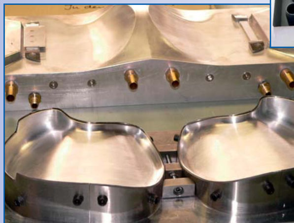
Sonderwerkzeug mit 3D-Schnitt